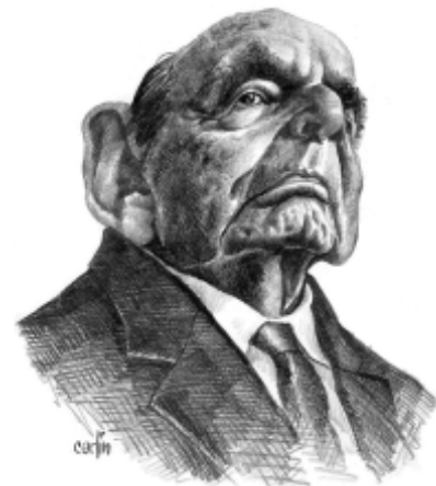
Jorge Basadre, Fundador de la Escuela de Bibliotecarios

SEDE AV. ABANCAY: AV. ABANCAY CDRA. 4 S/N, CERCADO (BIBLIOTECA PÚBLICA DE LIMA)