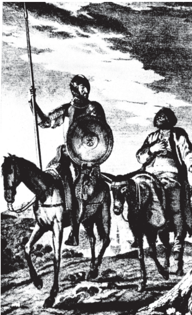
Don Quijote y Sancho. Edición de la Real Academia Española, 1780.