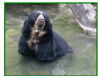
El oso de anteojos

El Parque Nacional Huascarán abarca 10 provincias del departamento de Ancash: Huaylas, Yungay, Carhuaz, Huaraz, Recuay, Bolognesi, Huari, Asunción, Mariscal Luzuriaga y Pomabamba. Estas albergan numerosas comunidades campesinas y muchas de estas áreas son tierras de pastoreo, barrios y áreas urbanas.