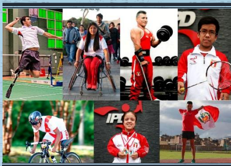
Presentación A Delegación Paralímpica Que Representó A Perú En Los Juegos Parapanamericanos 2019

ajustados a los espacios. Los familiares se vieron en la obligación de ejercer su papel como cuidadores y ayudar con los tratamientos, esto mismo fue detonante de estrés y tensión en los hogares peruanos.