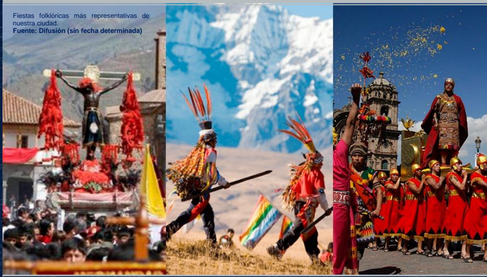
Fiestas folklóricas más representativas de nuestra ciudad.

Durante casi dos años de aislamiento social, muchos artistas, danzarines, cantantes, fieles devotos, entre otros que acompañábamos todas las actividades culturales y religiosas en la ciudad; nos encontramos tristes debido a que todo este bagaje ancestral, no solo consistía en simples manifestaciones sino formaba parte de nuestras vidas y hasta podríamos decir que ocupaban un lugar importante en nuestros corazones.