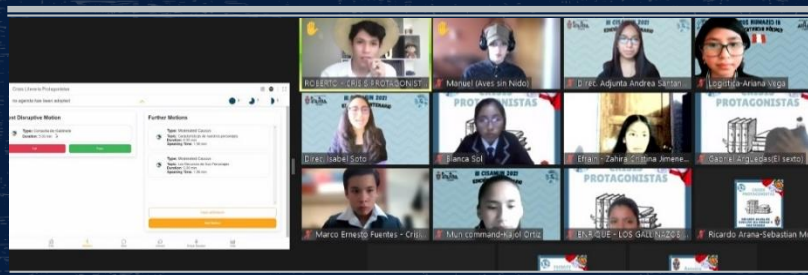
Delegados del CISAMUN 2021 del comité de Crisis Literaria Gabinete Protagonistas votando las mociones propuestas. Fotografía: Mariel Vega, logística del respectivo comité (02/09/2021)

“La búsqueda de una educación de calidad en el siglo XXI no solo abarca una sesión de clase basada en contenidos, sino desarrollar métodos de enseñanza activos para que los y las estudiantes sean agentes de cambio que fortalezcan el desarrollo de nuestro Perú y el mundo entero”