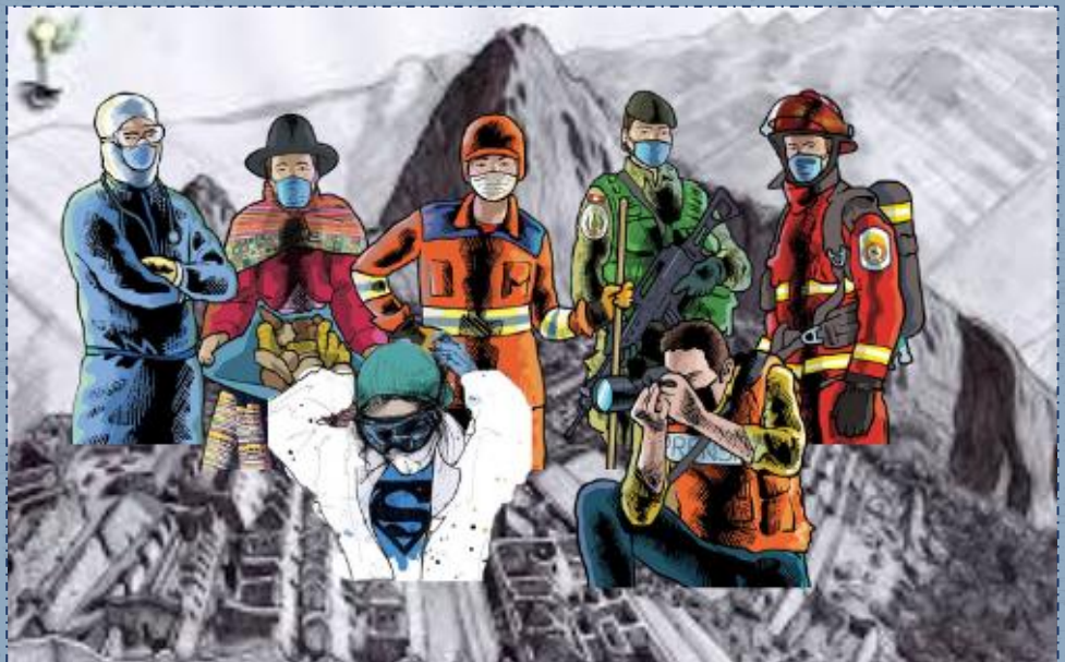
Héroes peruanos en el contexto de la pandemia actual.

Pues sí, estos son los héroes ocultos que construyeron y construyen con sangre, sudor y lágrimas nuestro país; viviendo su propia historia, luchando y enfrentando retos sin bajar la cabeza ni olvidarse de su querido Perú.