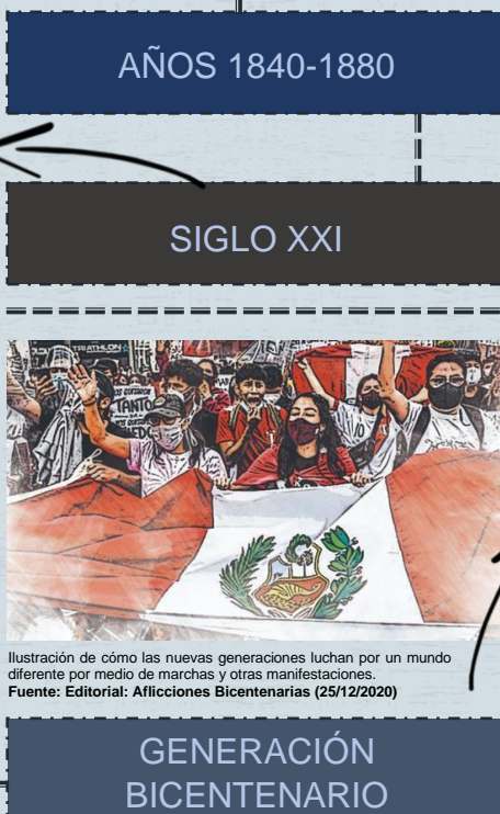
Ilustración de cómo las nuevas generaciones luchan por un mundo diferente por medio de marchas y otras manifestaciones.

Siglo XXI, en el cual nos situamos actualmente, el aumento de la pérdida de nuestro territorio es grave, saber cuanto daño le hicimos es impresionante, ya que cada día se pierden 427 hectáreas de esta. Las costas y el mar peruano poco a poco se convierten en playas de basura y nuestras especies marinas se van extinguiendo, los glaciares que por las altas temperaturas se van descongelando, entre otros que formarían una lista interminable de mencionar.