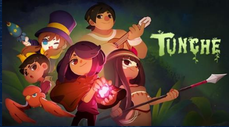
Portada del videojuego Tunche