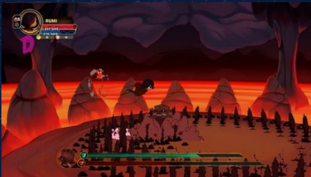
Un nivel del juego tunche donde tenemos como personaje a Rumi

T unche es un videojuego de aventura en 2D ambientado en la flora, fauna y folclor de la Amazonía peruana. Fue nombrado por la revista Polygon como uno de los 21 videojuegos independientes más esperados de este año. Al final de cada fase, el jugador tendrá un puntaje, lo que invita al usuario a retarse a sí mismo para mejorar.