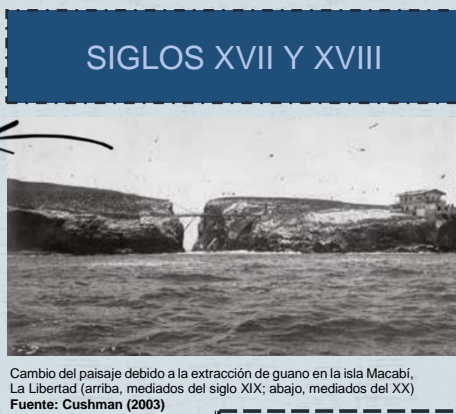
Cambio del paisaje debido a la extracción de guano en la isla Macabí, La Libertad (arriba, mediados del siglo XIX; abajo, mediados del XX)

Iniciamos en los siglos XVII y XVIII, donde la explotación del salitre estuvo enfocada en la producción de pólvora, fue así hasta llegar a la independencia, seguramente algo muy esperado para nosotros, pero aquí aparecería otro problema, que fue la contaminación del aire y las aguas por la extracción de los minerales en los yacimientos.