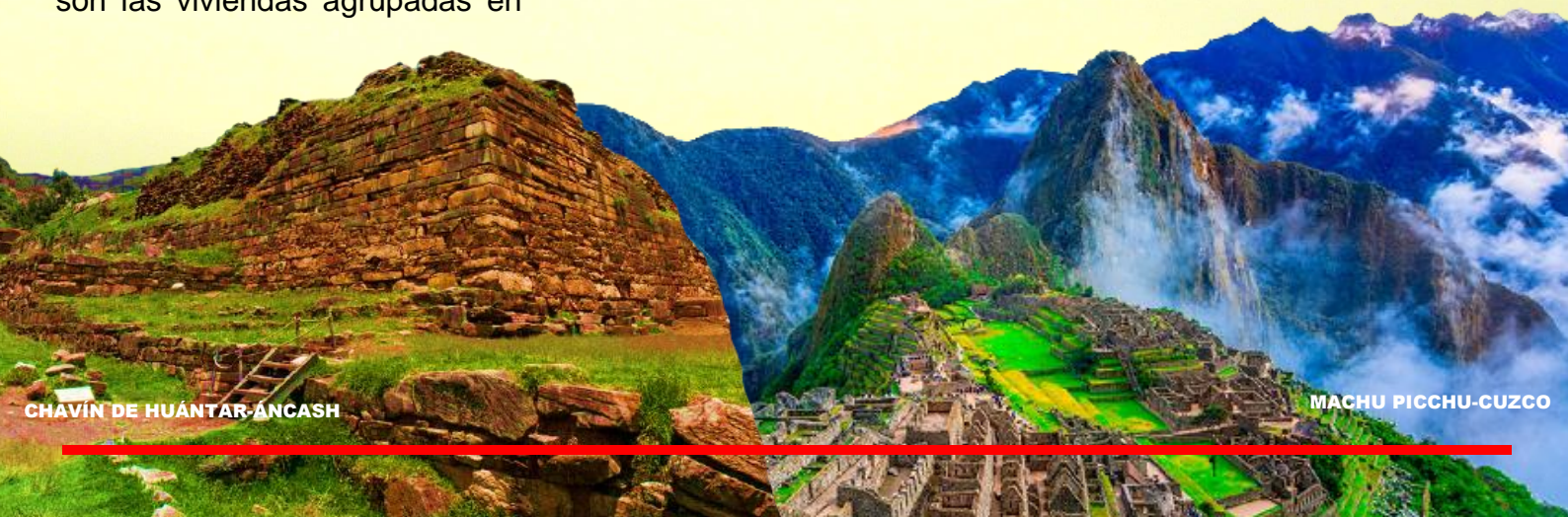
CHAVÍN DE HUÁNTAR-ÁNCASH

En la costa se edificaba desde remotos tiempos con adobes y adobones, y con quincha, en el caso de la construcción de viviendas populares o de recintos pequeños en la parte superior de los templos, ello no excluye la presencia de bases de piedra en muros costeros, como los de Chan Chan, ni de adobe y adobón en la sierra.