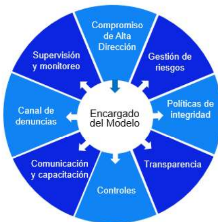
Gráfico N° 1 Modelo de Integridad

Es la herramienta que permite medir la adecuación de la entidad al estándar de integridad a través del desarrollo de los componentes y subcomponentes del modelo de integridad, evidenciando las brechas y oportunidades de mejora en su implementación.